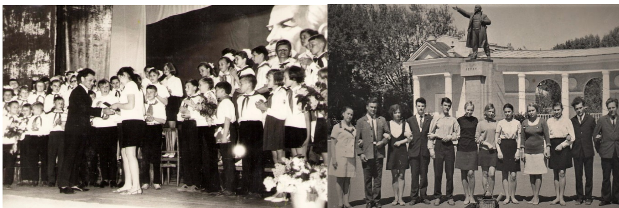
Первые выпускники (1970 год)